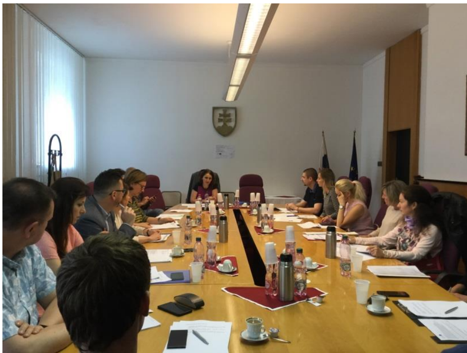
Legenda: Zasadnutie Pracovnej skupiny pre komunikáciu dňa 11. 05. 2018 na Úrade vlády SR

Pracovná skupina pre spoluprácu v oblasti verejného obstarávania (ďalej len „PSPSVO“) nezasadala, nakoľko v priebehu kalendárneho roka 2018 prebiehal legislatívny proces prípravy, pripomienkovania, rokovania a následného schvaľovania novely zákona o verejnom obstarávaní , na ktorom sa zúčastňovali všetci zástupcovia PSPSVO a prebiehala veľmi intenzívna odborná diskusia a komunikácia, na ktorej sa riešili rôznorodé otázky súvisiace s VO. Zároveň Úrad pre verejné obstarávanie (ďalej len „ÚVO“) predsedá Koordináčnemu výboru pre spoluprácu pri kontrole verejného obstarávania , ktorý zasadá na dvojmesačnej báze, na ktorom sa riešila problematika verejného obstarávania a ktorého členmi sú aj zástupcovia PSPSVO. Z vyššie uvedených objektívnych dôvodov sa riadne zasadnutie PSPSVO v priebehu kalendárneho roka 2018 neuskutočnilo.