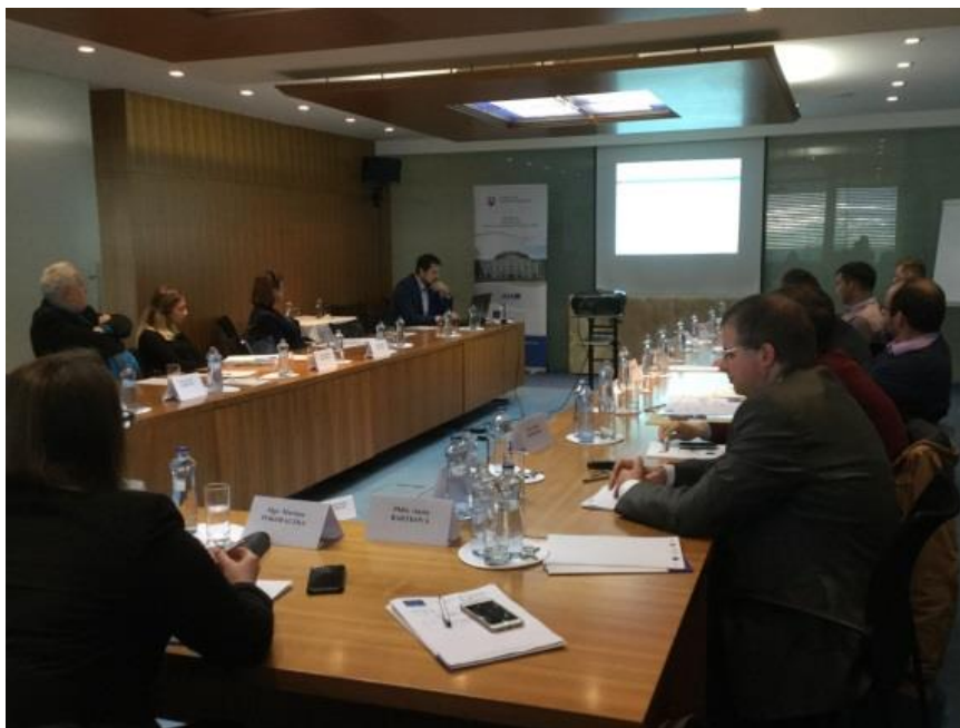
Legenda: Seminár Ochrana finančných záujmov EÚ v SR 03. - 04. 12. 2018, hotel Bôrik, Bratislava

Zamestnanci OCKÚ OLAF sa zúčastnili dňa 12. novembra 2018 aj školenia zameraného na prevenciu a boj proti korupcii pod názvom: „ Zvyšovanie právneho vedomia v oblasti prevencie korupcie a boja proti korupcii “ v Účelovom zariadení ÚV SR, hotel Bôrik v Bratislave, ktoré organizoval odbor prevencie korupcie na ÚV SR.